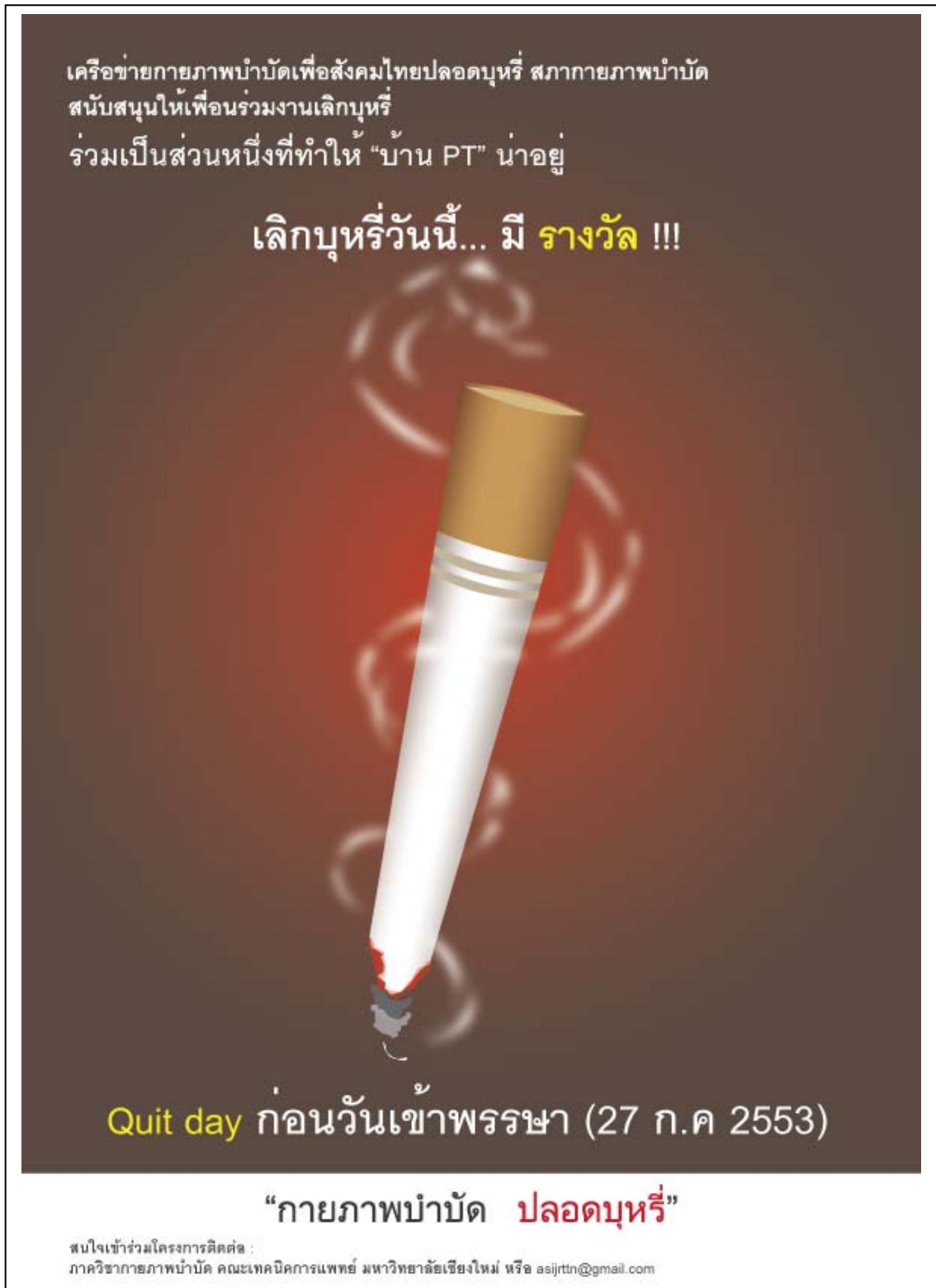
รูปที่ 4 เลิกบุหรี่วันนี้..มีรางวัล