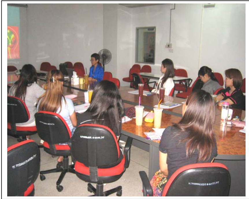
รูปที่ 1 แสดงการจัดอบรมผู้โทรศัพท์ให้กำลังใจผู้ต้องการเลิกสูบบุหรี่ โดยจัดวันที่ 9 และ 12 กค 2553 ณ ภาควิชากายภาพบำบัด คณะเทคนิคการแพทย์ มหาวิทยาลัยเชียงใหม่

รายชื่อผู้เข้าร่วมอบรม โดยระยะเวลาการอบรม นาน 6 ชั่วโมง